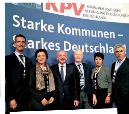
Überregionales Engagement - für die Region.

Ich bin Röthenbacherin und Gymnasiallehrerin für Englisch, Spanisch und Italienisch. Seit zwölf Jahren bin ich Stadträtin und Jugendbeauftragte und wurde 2008 in den Kreistag gewählt, wo ich das Amt der Vorsitzenden der CSU-Kreistagsfraktion bekleide. Daneben engagiere ich mich als Kreisvorsitzende der Kommunalpolitischen Vereinigung (KPV) im Nürnberger Land, in verschiedenen Arbeitsgemeinschaften sowie als Mitglied der CSU-Zukunftskommission.