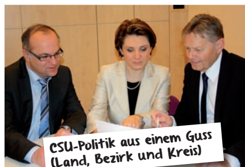
CSU-Politik aus einem Guss (Land, Bezirk und Kreis)

„Ich möchte mit Verstand, aber vor allem mit Herz die Zukunft des Nürnberger Lands gestalten. Denn Menschlichkeit steht für mich an erster Stelle.“