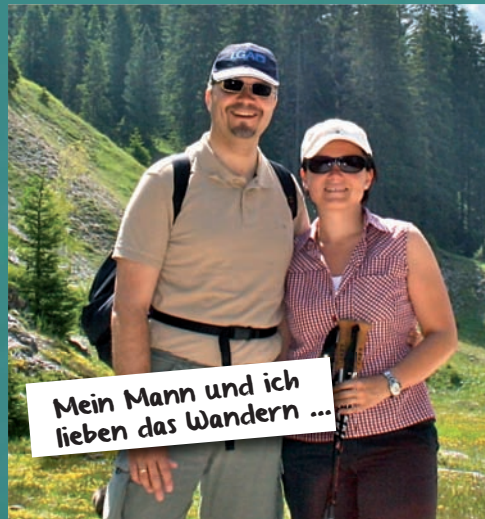
Mein Mann und ich lieben das Wandern ...