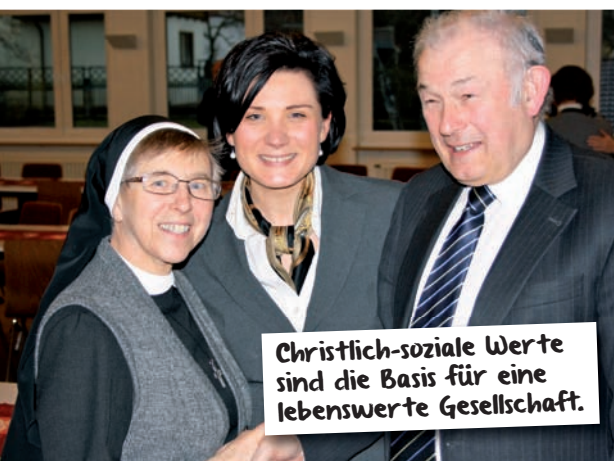
Christlich-soziale Werte sind die Basis für eine lebenswerte Gesellschaft.