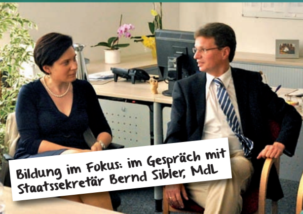
Bildung im Fokus: im Gespräch mit Staatssekretär Bernd Sibler, MdL