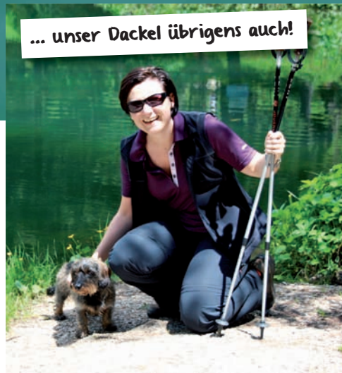
... unser Dackel übrigens auch!