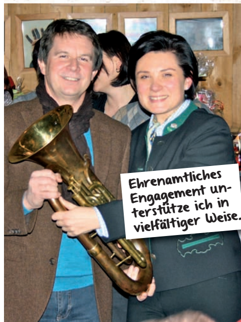
Ehrenamtliches Engagement unterstütze ich in vielfältiger Weise.